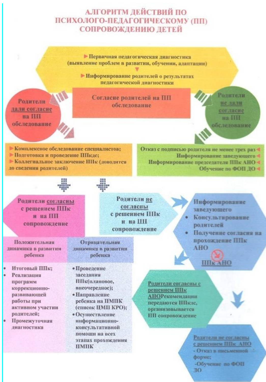
Алгоритм действий по психолого-педагогическому сопровождению детей (рис.1)

http://publication.pravo.gov.ru/Document/View/0001202301270036?pageSize=1&index=568